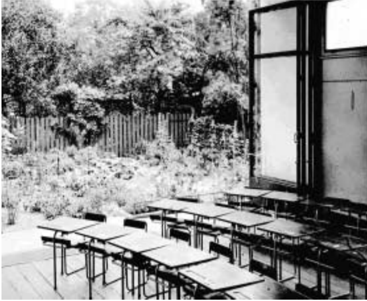
Versuchspavillon in Frankfurt am Main, 1929/1930