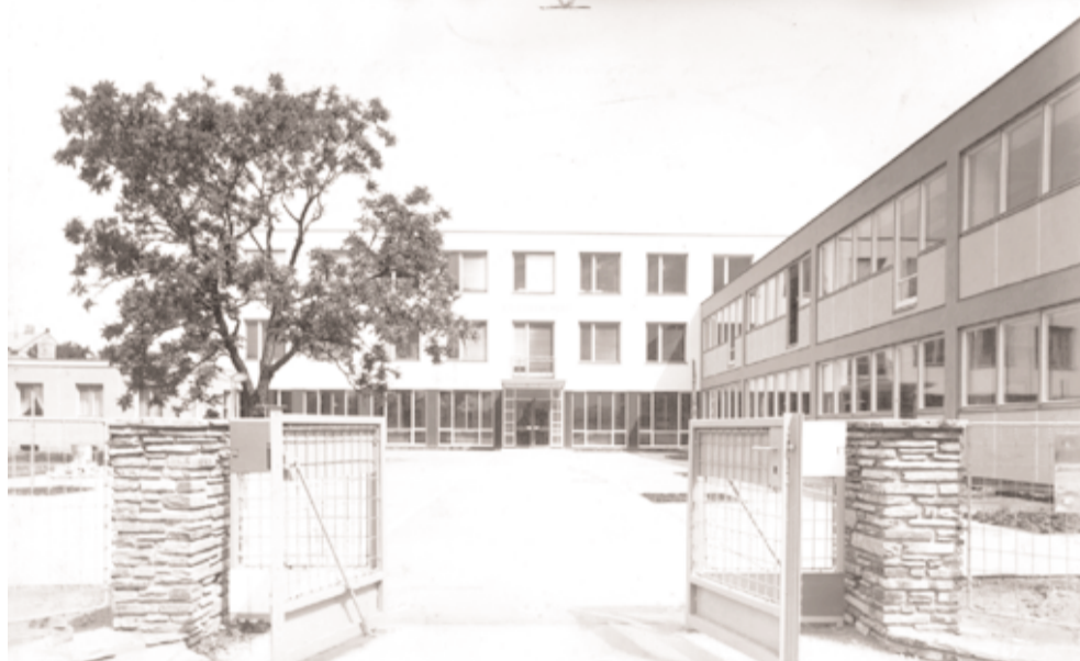
Haupteingang, historische Aufnahme

Ein Beitrag der ÖGFA von Maja Lorbek und Gerhild Stosch