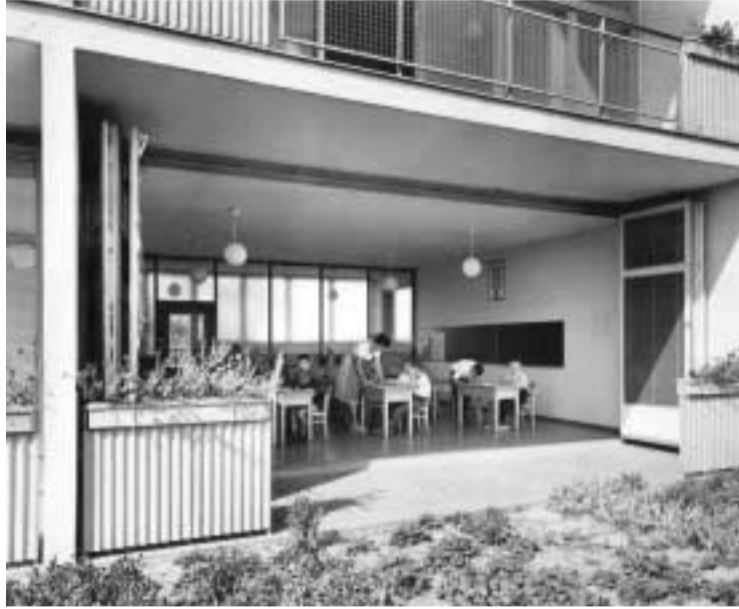
Historische Aufnahme der Freiluftklasse

dukte und der Normen für Neubauten, mutieren bestehende Gebäude formal zu „Quasi-Neubauten“. Die heterogene Vielfalt der Formensprachen aus verschiedenen Epochen – von der lebendig abgewitterten Kalkputzfassade bis zum frivol vorgehängten Waschbeton der siebziger Jahre – wird reduziert auf die stets gleiche Oberfläche (Dünnputz auf Vollwärmeschutz) und identischen Fensterprofile.