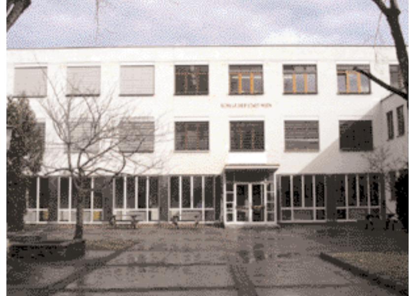
Haupteingang nach der Sanierung

Wilhelm Schütte, tätig in der Schulbauabteilung des Frankfurter Hochbauamtes, entwickelte dort sein Konzept der Freiluftschule. In beiden 1929 bzw. 1930 erbauten Versuchspavillons sind fast alle Elemente seiner typologischen Innovation enthalten: Das Prinzip der zweiseitigen Belichtung, die sich zur Gänze öffnende faltglaswand und die freie Anordnung der Einzeltische. Dieses Konzept hat er im Laufe seines architektonischen Schaffens weiter verfolgt und optimiert, zu Realisierungen kam es jedoch selten. Die Prinzipien seines Schultyps hat Wilhelm Schütte in zahlreichen Publikationen, besonders in der Nachkriegszeit, dargelegt und anhand der Zeichnungen und Diagramme erläutert.