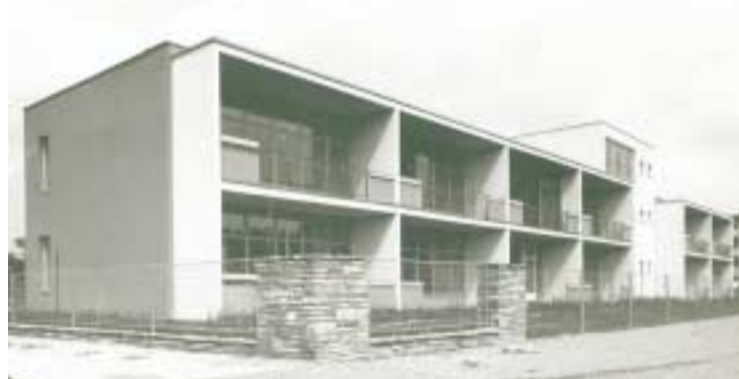
Klassenzimmertrakt, historische Aufnahme

In der Sonderschule Floridsdorf sind alle Elemente, die so lange theoretisch und experimentell vorbereitet wurden, realisiert. Die Schulklassen, auch im Obergeschoß, sind beidseitig belichtet, eine Seite direkt über die Außenwand. Hier wird die Lichteinstrahlung durch die auskragende Loggiaplatte gemil-