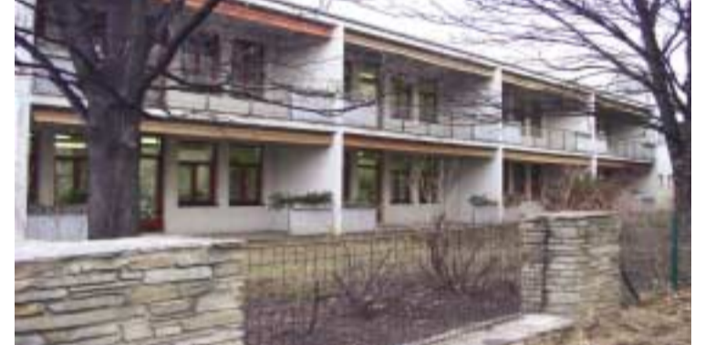
Klassenzimmertrakt nach der Sanierung.